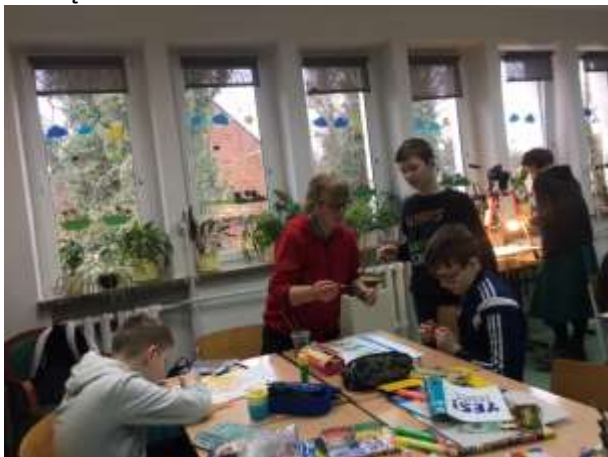
5. Zajęcia warsztatowe „Przygotowanie materiału do kręcenia filmu”.